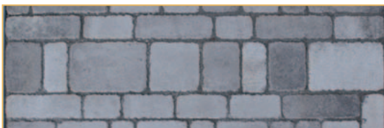
Romba Via Regia original Gletscher