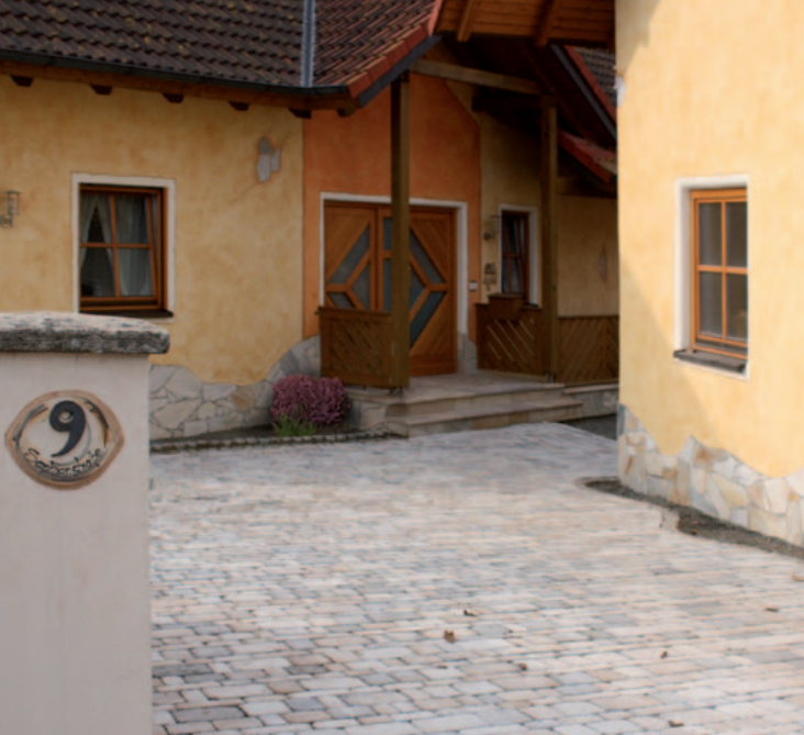
Romba Via Regia original Muschelkalk Typ 1