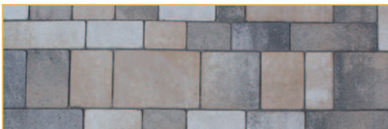
Romba plan Via Regia original Muschelkalk Typ I