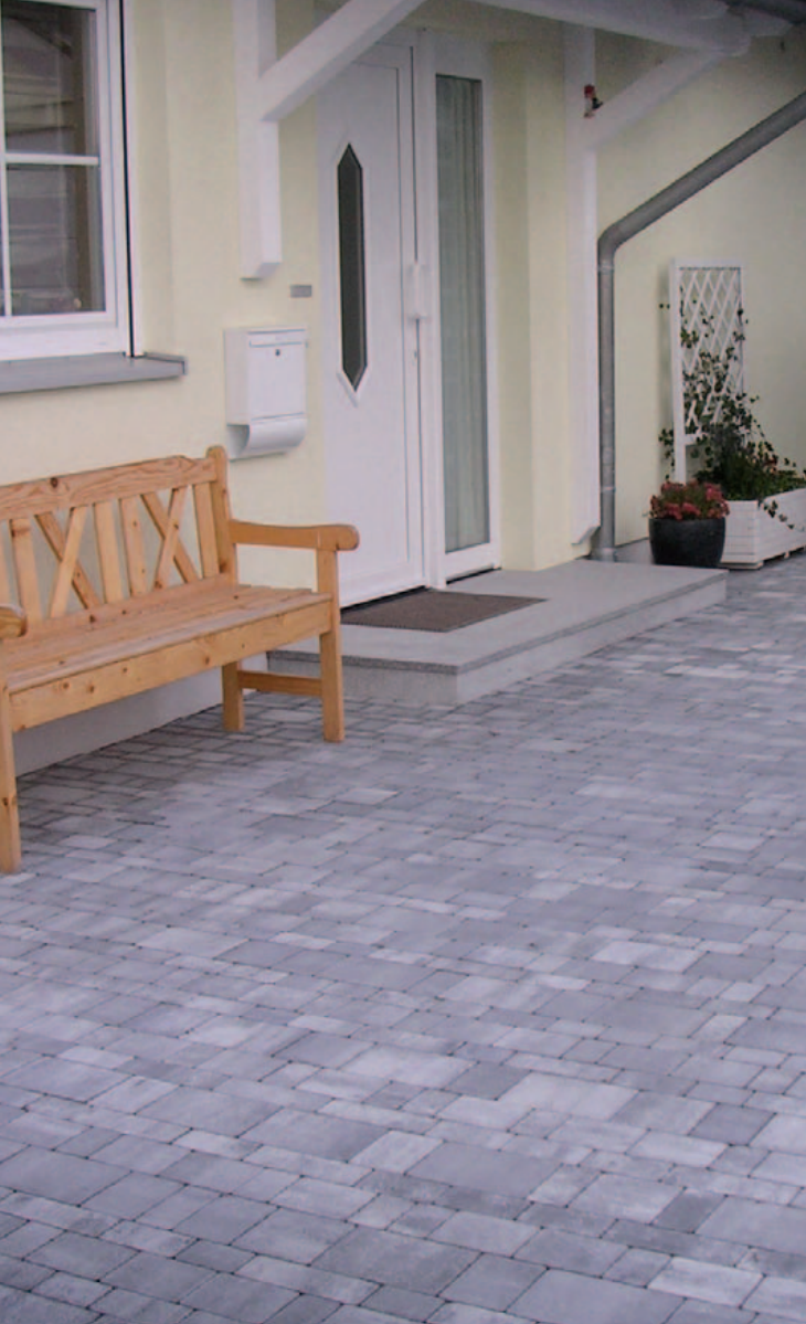
Romba plan Via Regia original Gletscher