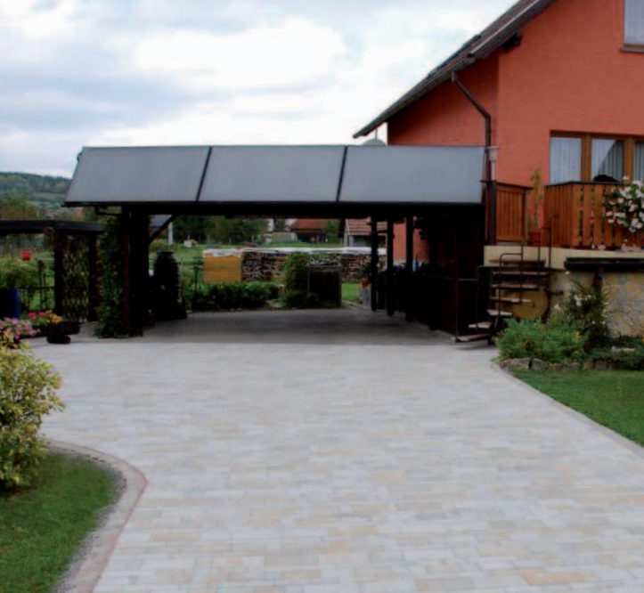
Romba plan Via Regia original Muschelkalk Typ Sand

Mit unserem Romba Sixpack haben Sie in jeder Hinsicht die freie Wahl.